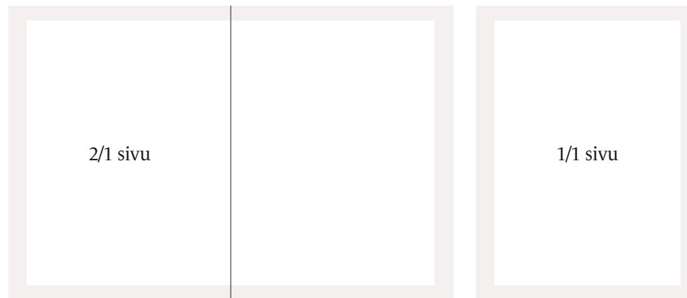
400 x 265 mm

1/2 sivua vaaka: 200 x 128 mm + leikkuuvarat 3 mm