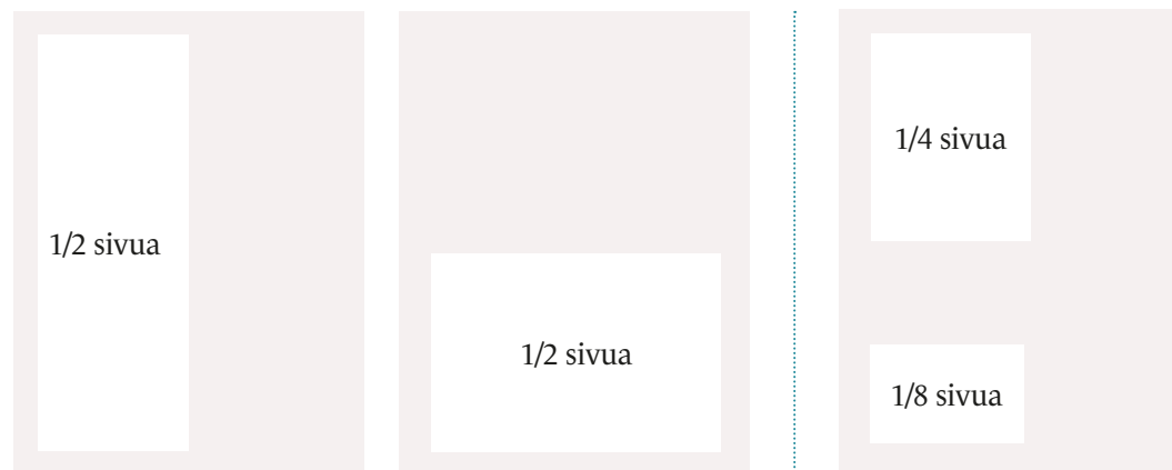
96 x 265 mm