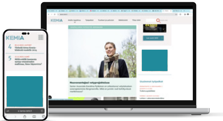
300 x 300 px / 980 x 400 px