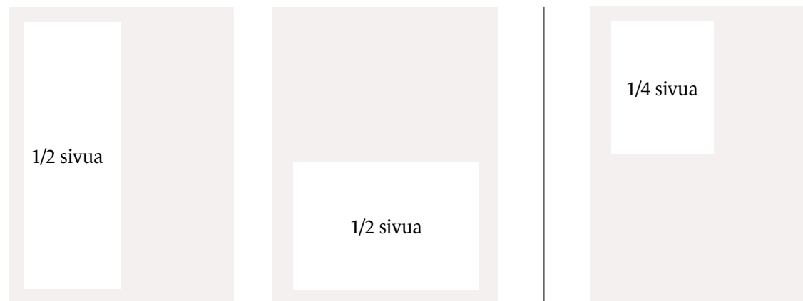
96 x 265 mm